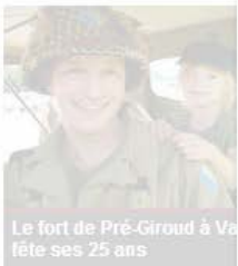
Le fort de Prê-Giroud à Vevey fête ses 25 ans