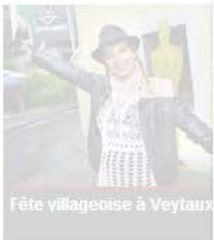
Fête villageoise à Veytaux