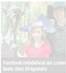
Festival médiéval au coeur des Brigands